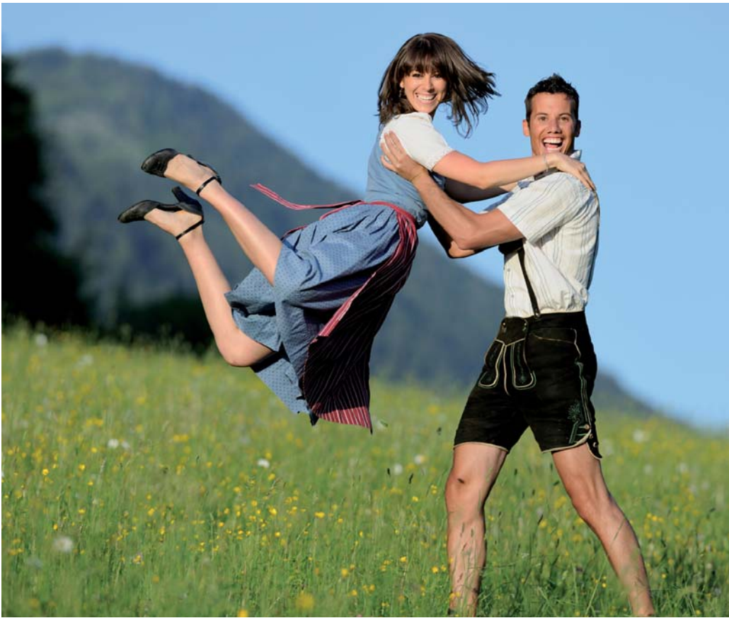
Ein fesches Wiesn-Outfit! In Dirndl, Lederhose und Co. feiert es sich besonders stilvoll.