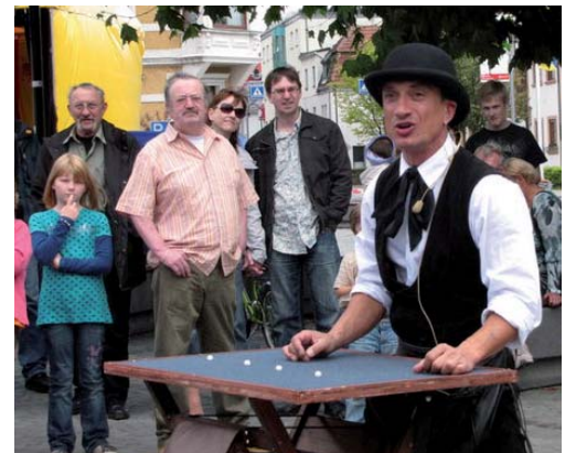
Rono sorgt für Aufsehen.