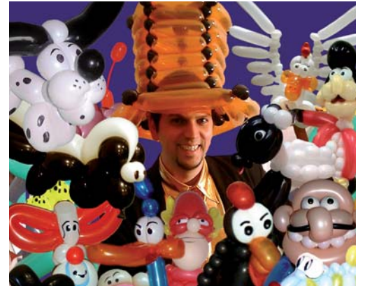
Kleine Kunstwerke zum Nachhausenehmen.

Für alle, die einmal besonders hoch hinauswollen, gibt es das Rivella-Kletterbergli. Der Wiesn-Wiesl ist schon ganz gespannt, wer den Gipfel als Erstes bezwingt und von oben Papi, Mami und dem ganzen Bahnhof zuwinken kann.