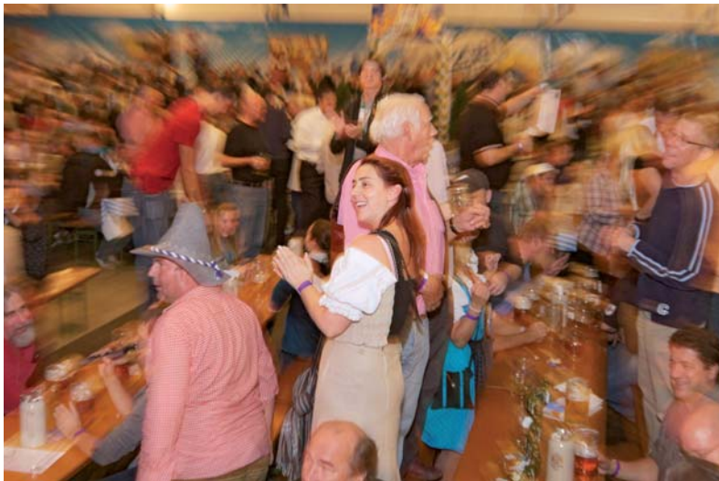
Die Gläser hoch! Die 5. Züri-Wiesn – Unser Oktoberfest lädt zum fröhlichen Feiern ein.

Alle Wiesn-Angebote in der Übersicht. SEITE 4